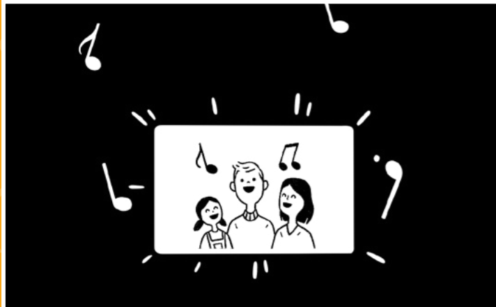
.크큘크 크리트부 클레코 클레방 클레 코코스도드 수코