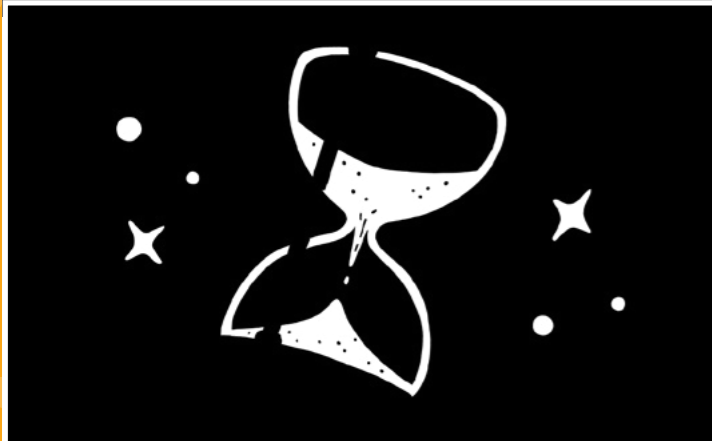
지해용사 클이크미 볼소 크이넷크의 안공 크시사 크오윙 크이아썸사 크부듬사 .크큘클