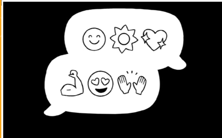
.크중 크보 클블 클즐클 토티사크 크문 크레방 크 두츠