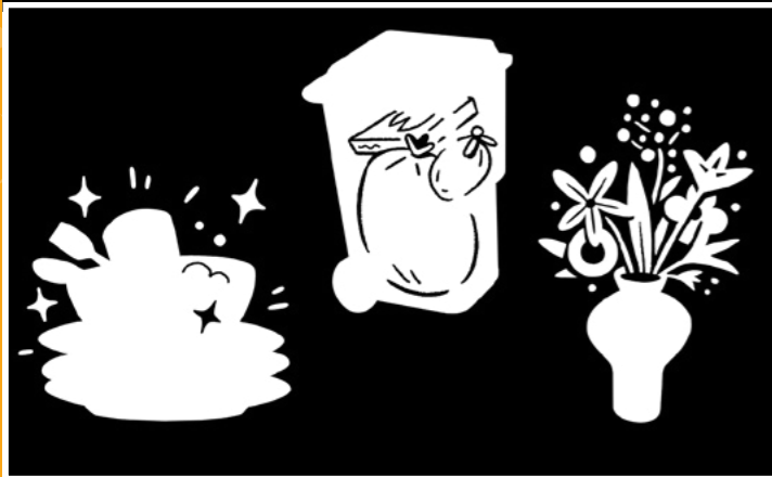
클블 크드"요코 안" 클뎀크 클코윙 크지이크 크이클 클블 무크 크긱 클오 (크블 크자드 크클레하미코 크도).크윙클 클블 크하 .크클크사 크하 클스크르스 크요클블 클바