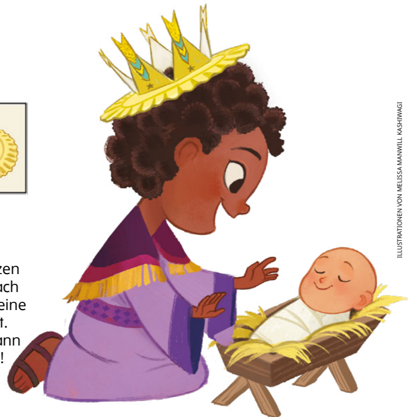
ILLUSTRATIONEN VON MELISSA MANWILL KASHIWAGI

3. Falte den Teller wieder auseinander. Biege die Spitzen in der Mitte nach oben, sodass eine Krone entsteht. Verziere sie dann nach Belieben!