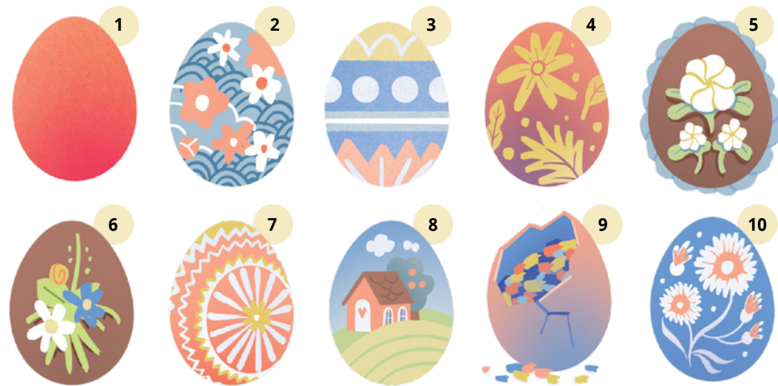
Megfejtések a 30. oldalon.