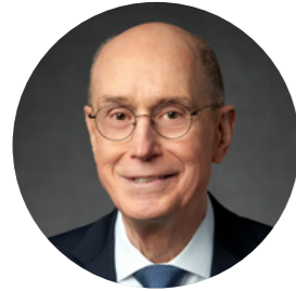
Presidentti Henry B. Eyring toinen neuvonantaja ensimmäisessä presidenttikunnassa