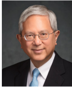
Gerrit W. Gong