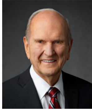
Russell M. Nelson Präsident