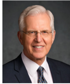
D. Todd Christofferson