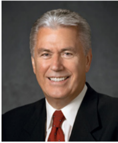
Dieter F. Uchtdorf