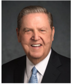
Jeffrey R. Holland