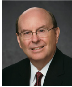
Quentin L. Cook