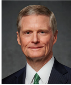
David A. Bednar