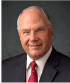
Ronald A. Rasband