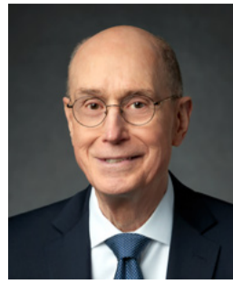
Henry B. Eyring Zweiter Ratgeber