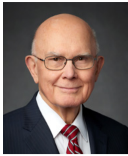
Dallin H. Oaks Erster Ratgeber