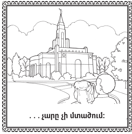
... չարը չի մտածում: