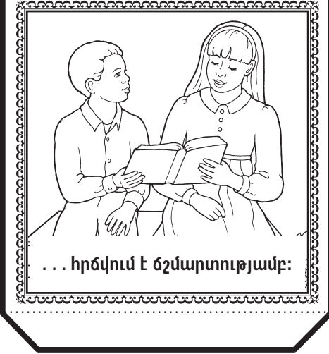
... հրճվում է ճմարտությամբ: