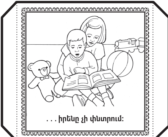
... իրենը չի փնտրում:

Գունավորեք նկարները, ապա կտրեք հոծ սև գծերով ուրվագծված պատկերը: Ծալեք բոլոր կետագծերը և սոսնձեք կամ կաշուն ժապավենով իրար միացրեք եզրերը, որպեսզի պատրաստեք խորանարդիկ: Նետեք խորանարդիկը և ասացեք, թե ինչպես կարող եք գթություն ցուցաբերել այն ձևով, որը նշված է խորանարդիկի վերևի վանդակում: Եթե վերևի վանդակում հայտնվում է գթություն բառը, պատմեք, թե ինչպես էր Փրկիչը ցույց տալիս իր սերը: