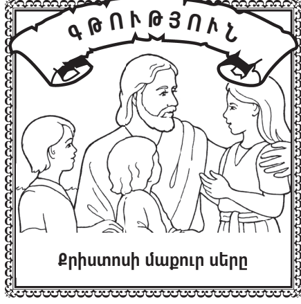
Ջրիստոսի մաքուր սերը