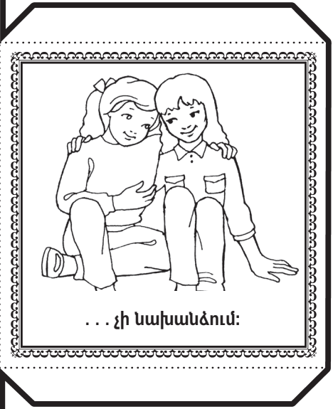
... չի նախանձում: