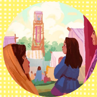
장립, 하나님, 계명을 지킴, 영

베냐민 왕은 백성에게 그리스도의 이름을 받들라고 권유했어요. 그것은 곧 하나님을 따르고 그분의 계명을 지키겠다는 성약, 즉 약속을 하라는 의미였어요.