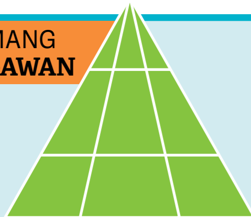
Tubag anaa sa pahina 31. Biswal nga solusyon diha sa ftsoy.ChurchofJesusChrist.org .