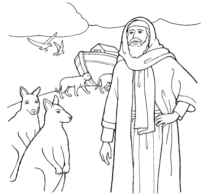
Noa (Na iVakatekivu 6-8)

sai koya na vakadinata na veika eda sega ni raica.