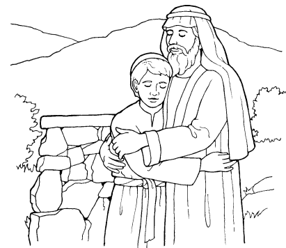
Eparama (Na iVakatekivu 22:1-14)