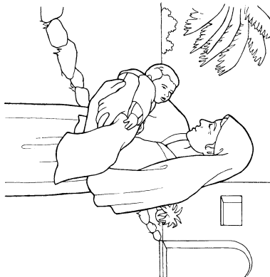
Sera (Na iVakatekivu 21:1-8)