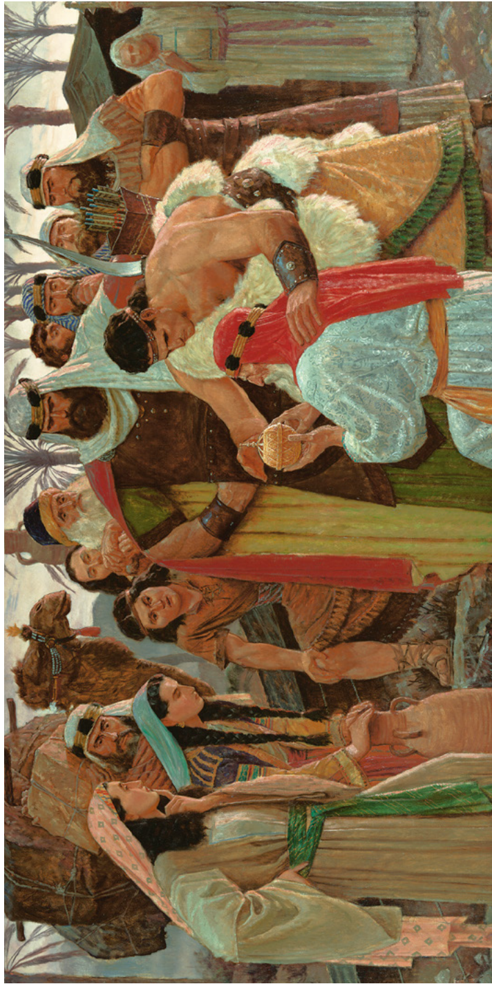
Lehi udi ujjandula Liahona Dizola ne langi kudi Arnold Friberg Tangila ku 1 Nefi 16, mabeji 38–41