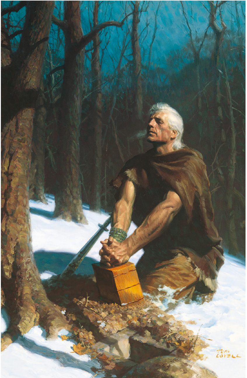
Moloni udi ujika miandiku ya Bena Nefi Dizola ne langi kudi Tom Lovell Tangila ku Molomo 8, mabeji 589–593