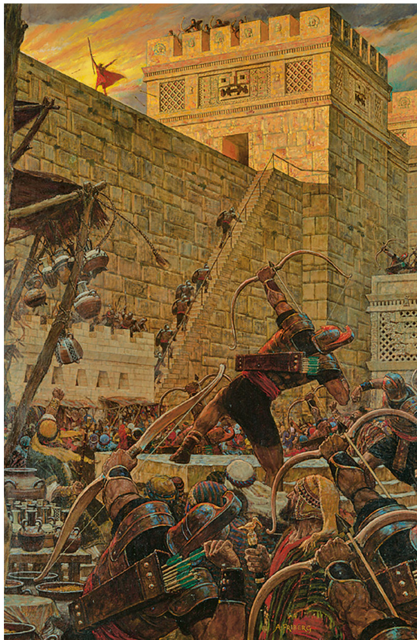
Samuele Muena Lamana udi wamba ku Nyuma Dizola ne langi kudi Arnold Friberg Tangila ku Helamana 16, mabeji 497-499