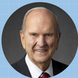
predsjednik Russell M. Nelson