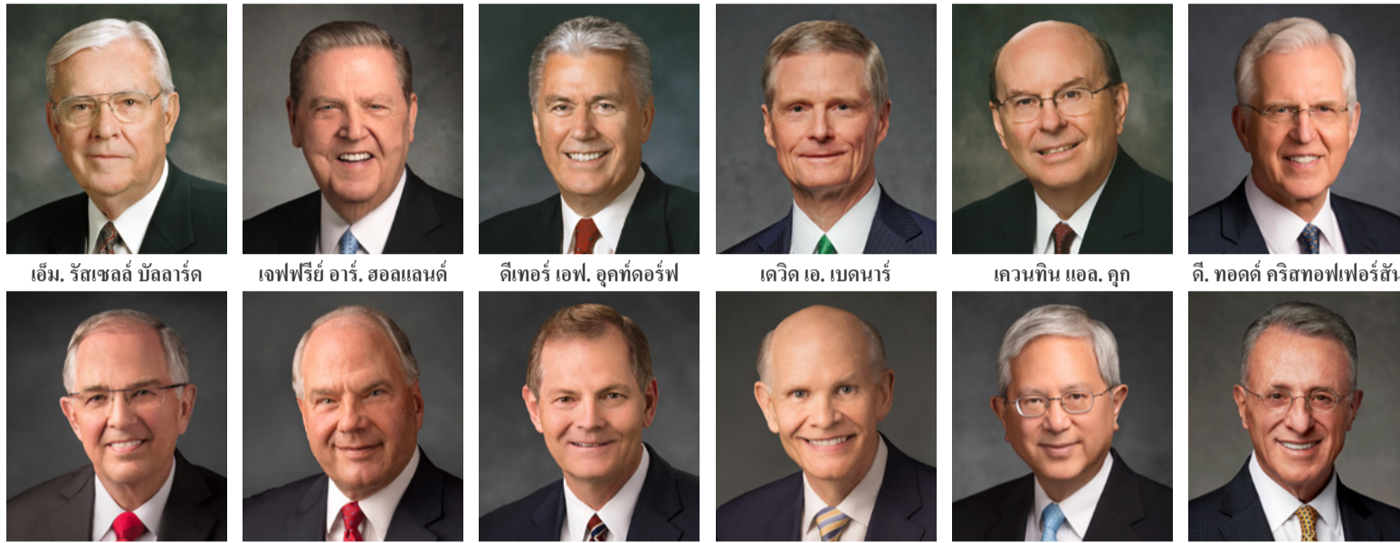
เอ็ม. รัสเซลล์ บัลลาร์ด