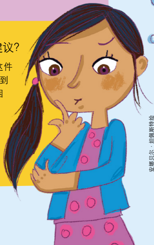
安娜贝尔·坦佩斯特绘

有时候，我也不确定自己是否感受到圣灵。但是如果你认真思考这件事，阅读经文、祈祷，而且有好的感觉，那就是圣灵了。有时候听到圣灵不仅是一种感觉，也可以是一个念头或想法。如果你仍然感到困惑，可以一直祈祷，再次求主帮助。