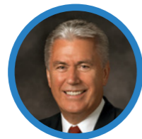
E. 'Eletā Dieter F. Uchtdorf