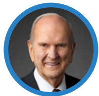
A. Palesiteni Russell M. Nelson

"Ngaahi mātu'a, fakamālo atu 'i he me'a kotoa pē 'oku mou fai ke ohi hake ai ho'omou fānaú. Pea ki he fānaú, fakamālo atu 'i he me'a kotoa pē 'okú ke fai ke ohi hake ho'o mātu'a."