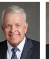
ប្រេន អេច ឆៀលសិន