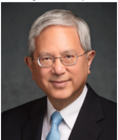
ហ្វ្រែន ដបុលយូ ហ្គង់