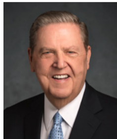
ជែប្រ័យ អ័រ ហ្វូឡិន