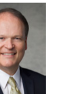
ម៉ាកស ប៊ី ណាស