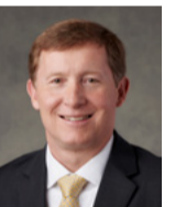
មិល ថេត បាធី ទីប្រឹក្សាទីពីរ