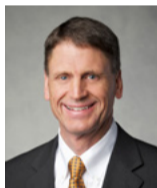
ម៉ាល ប៊ី យុក