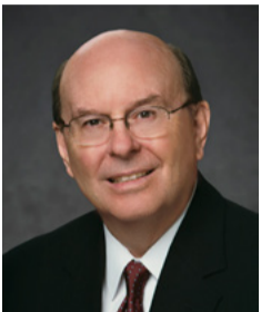
ហ្វ្រែន មិល យុក