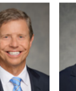
អេស ម៉ាក ផលថេរ