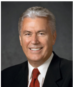
ខៀវ ច័រ អេហ្វ អុដដុល្ល