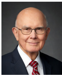
ដាណូន អេក អ៊ុក ទីប្រឹក្សាទីមួយ