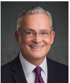
ផាទ្រីក ខៀវនៃ