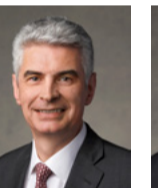
វ៉ែល មិល កូសសេ ប៊ីស្ស្រាណាអធិបតី