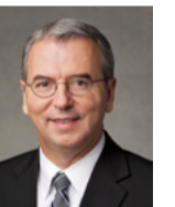
ម៉ាឡេ អេ ហ្គេដយ