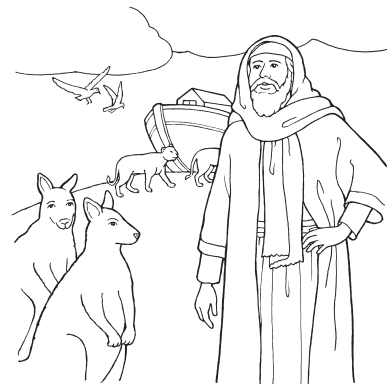
Nuh (Kejadian 6-8)

adalah memercayai hal-hal yang tidak dapat kita lihat.