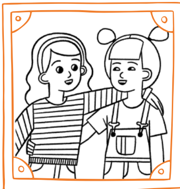
Buokiiia aomata n namakina bwa a butimwaeaki.

Kamatoaaki: Imwiin are ko a tia ni bwabetitoaki, ko karekea te kakabwaia ae onoti man te nakoanibonga n riki bwa te membwa n ana Ekaretia Iesu Kristo ao ni karekea ana bwaintituaraoi te Tamnei ae Rairoi.