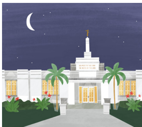
Храм в Абе, Нигерия