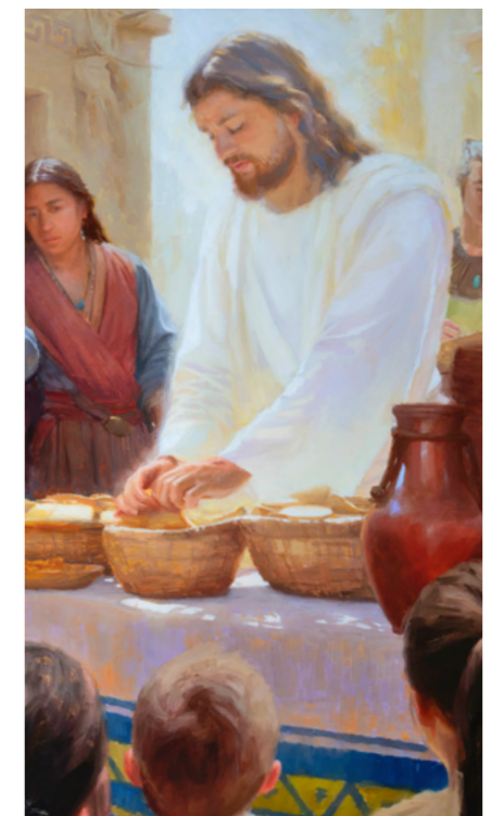
ภาพประกอบโดย อลิซาเบธ ฮาร์ตสัน