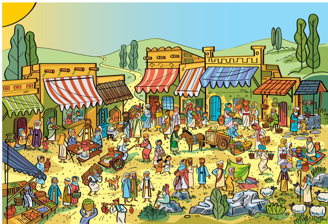
Das Lösungsbild findest du auf ftsoy.ChurchofJesusChrist.org .

Jeder der ursprünglichen zwölf Apostel befindet sich irgendwo in der Stadt. Kannst du sie alle finden?