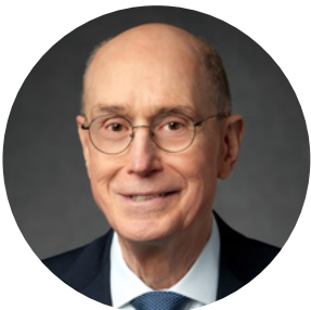
Ni Presidente Henry B. Eyring

Ikaduhang magtatambag sa Unang Kapanguloan