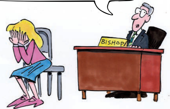
イラスト：チャドウィック・ハックリー

最後にもう一度だけ言いますが、宣教師申請書の提出は手伝えません。まだ12歳なんだから。