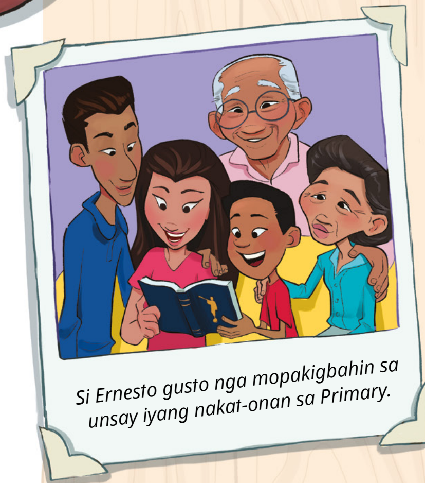
Si Ernesto gusto nga mopakigbahin sa unsay iyang nakat-onan sa Primary.