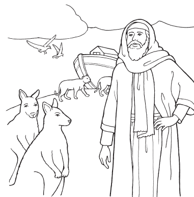
Noach (Genesis 6 bis 8)

ist, wenn man von etwas überzeugt ist, was man nicht sieht