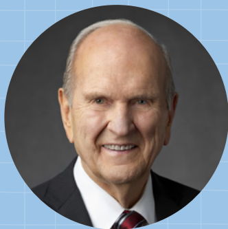
Presidente Russell M. Nelson