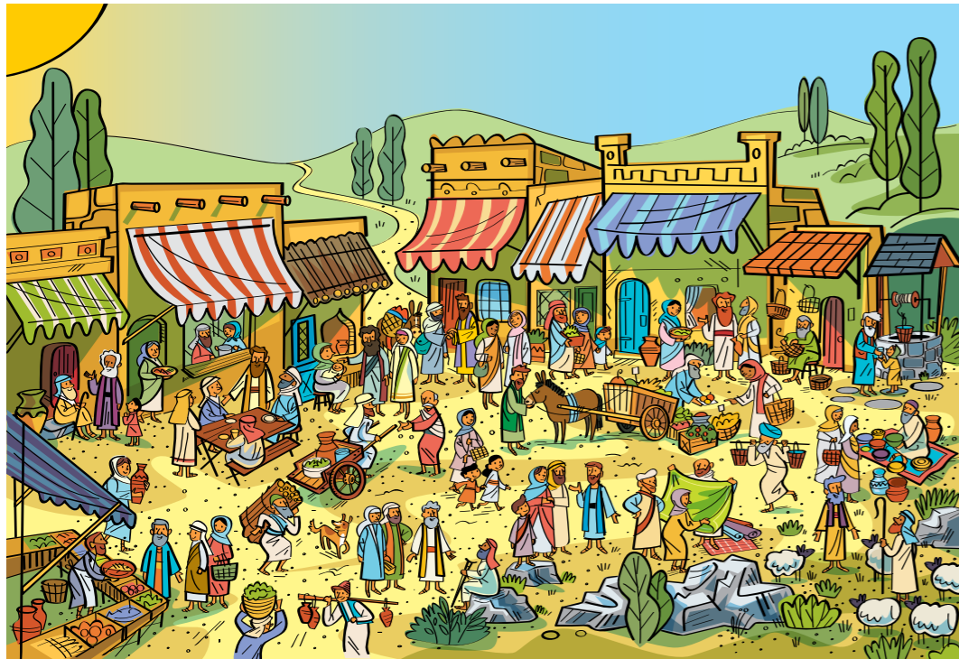
Kuvaratkaisu on sivustolla fsoy.churchofjesuschrist.org .

Kukin alkuperäisistä kahdestatoista apostolista on jossakin päin kaupunkia. Löydätkö heidät kaikki?