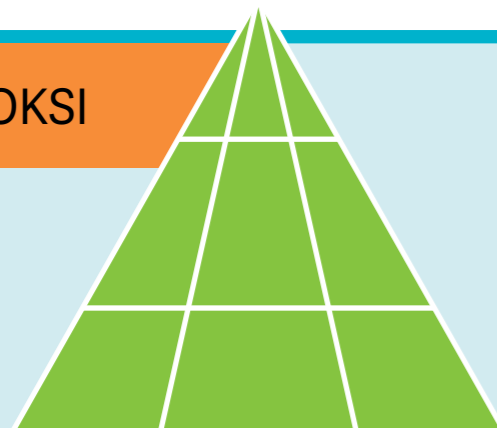
Vastaus sivulla 31. Kuvaratkaisu on sivustolla fsoy.churchofjesuschrist.org .