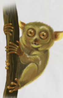
Laļ en ej jikin 70% in menin eddōk im menin mour ko ilo laļ in.