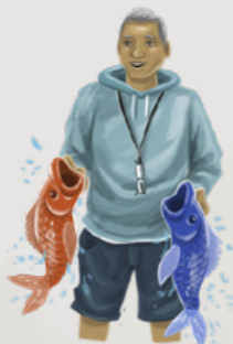
Emņan eņod ippān Felipe.