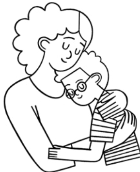
Hago todo lo posible por tomar buenas decisiones y guardar los mandamientos de Dios.

Expiación de Jesucristo: El sacrificio que hizo Jesucristo cuando sufrió y murió por nosotros y luego se levantó de nuevo. Gracias a Su expiación volveremos a vivir después de morir, y también podemos arrepentirnos.