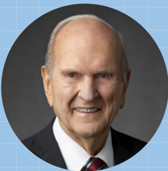
Av president Russell M. Nelson