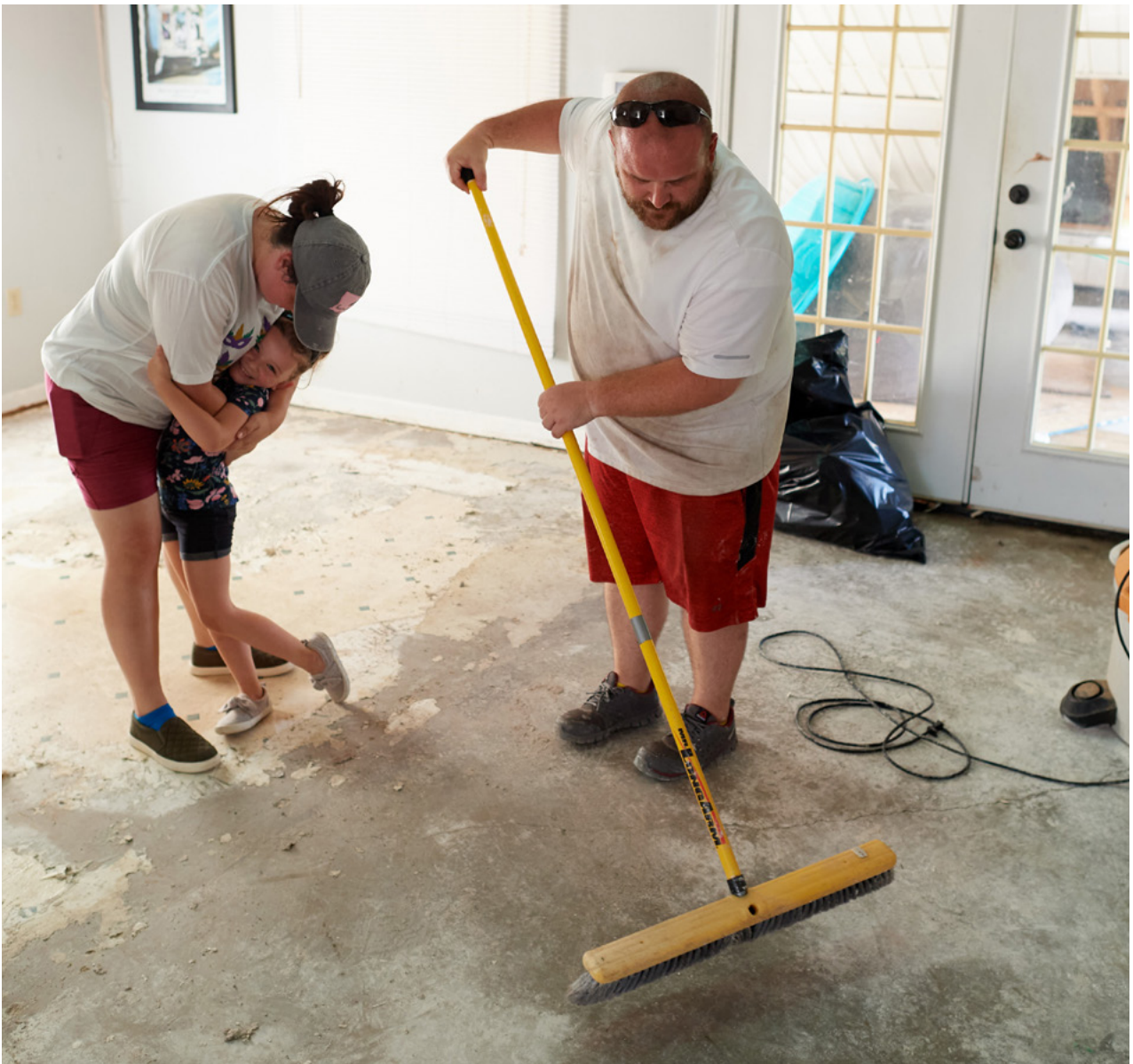
위: 허리케인 아이다가 지나간 이후 예수 그리스도 후기 성도 교회의 회원들을 포함해 지역사회 자원봉사자들이 노동절 주말 축제 기간을 청소하는 데 보냈다.