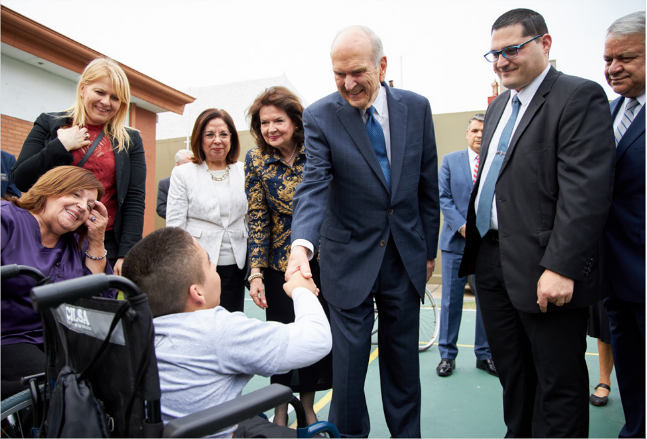
위: 2019년 라틴 아메리카 성역 중에 러셀 엠 넬슨 회장이 아르헨티나의 휠체어 배우 행사에 참여했다.