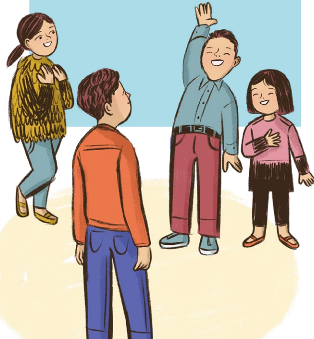
삽화: 케이티 도크릴

어린이들이 의자 위에서 서서 사무엘처럼 예수 그리스도에 대해 아는 것을 나누는 동안 잡아주세요.