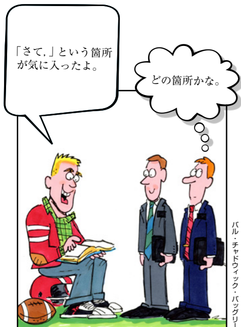
答えは31ページにあります。答えを示した図は ftsoy.ChurchofJesusChrist.org にあります。