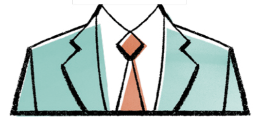
答えは31ページにあります。