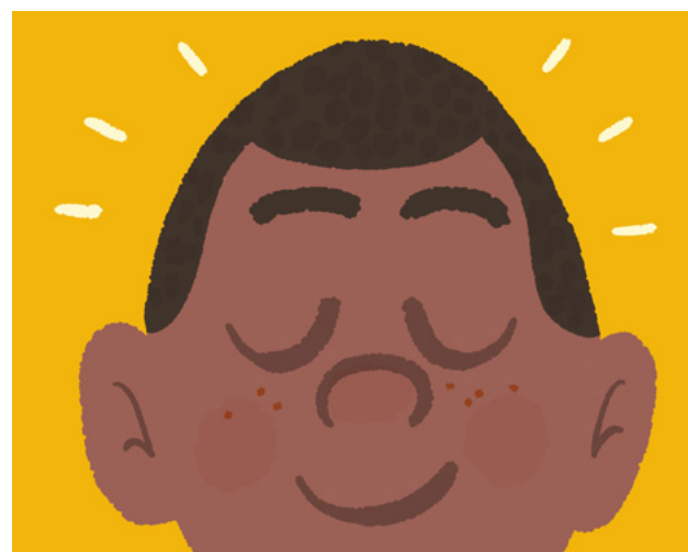
Nanome antsika ny fanasan'ny Tompo i Jesoa satria tia antsika Izy.