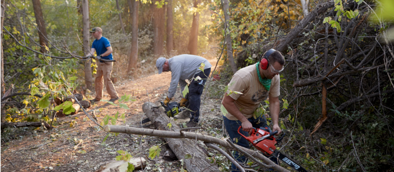
Sopra: I volontari di una congregazione della Chiesa a Kaysville, nello Utah, raccolgono legna da ardere nelle aree colpite da una bufera. La legna da ardere è stata poi consegnata ai residenti della Riserva Navajo.