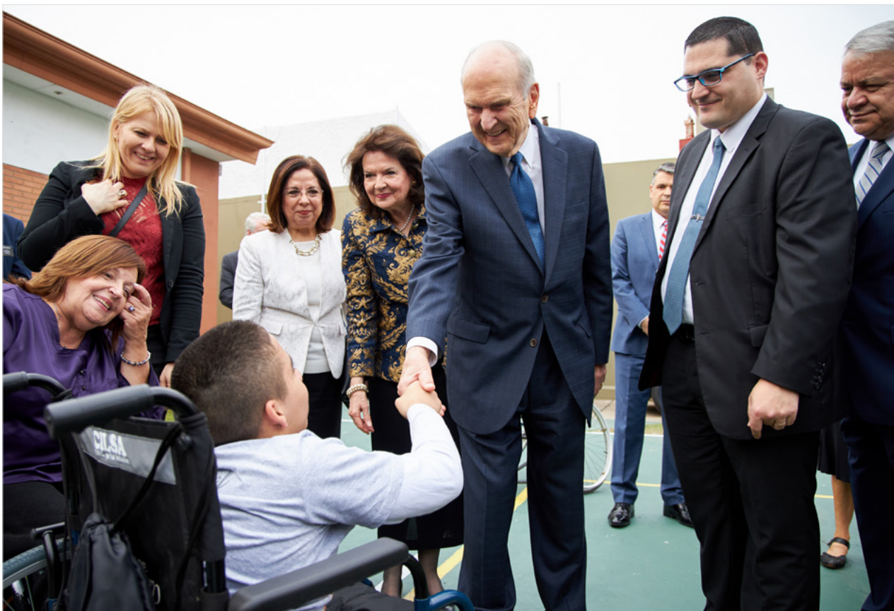
Sopra: Durante il suo ministero in America Latina nel 2019, il presidente Russell M. Nelson ha partecipato a un evento di distribuzione di sedie a rotelle in Argentina.