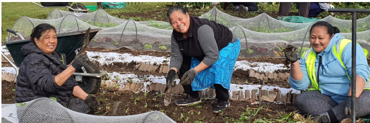
Sopra: I membri della Chiesa di Auckland, Nuova Zelanda, collaborano con altre organizzazioni civiche per diserbare i giardini e abbellire la loro comunità.