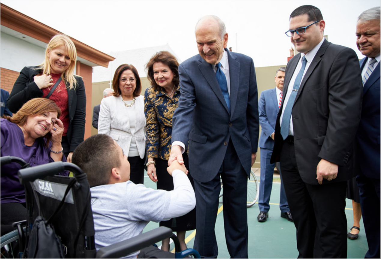
I Luga: I le taimi o lana galuega i Amerika Latina i le 2019, sa auai ai Russell M. Nelson i se gaoioiga na tufatufaina atu ai nofoa faataavalevale i Atenitina.