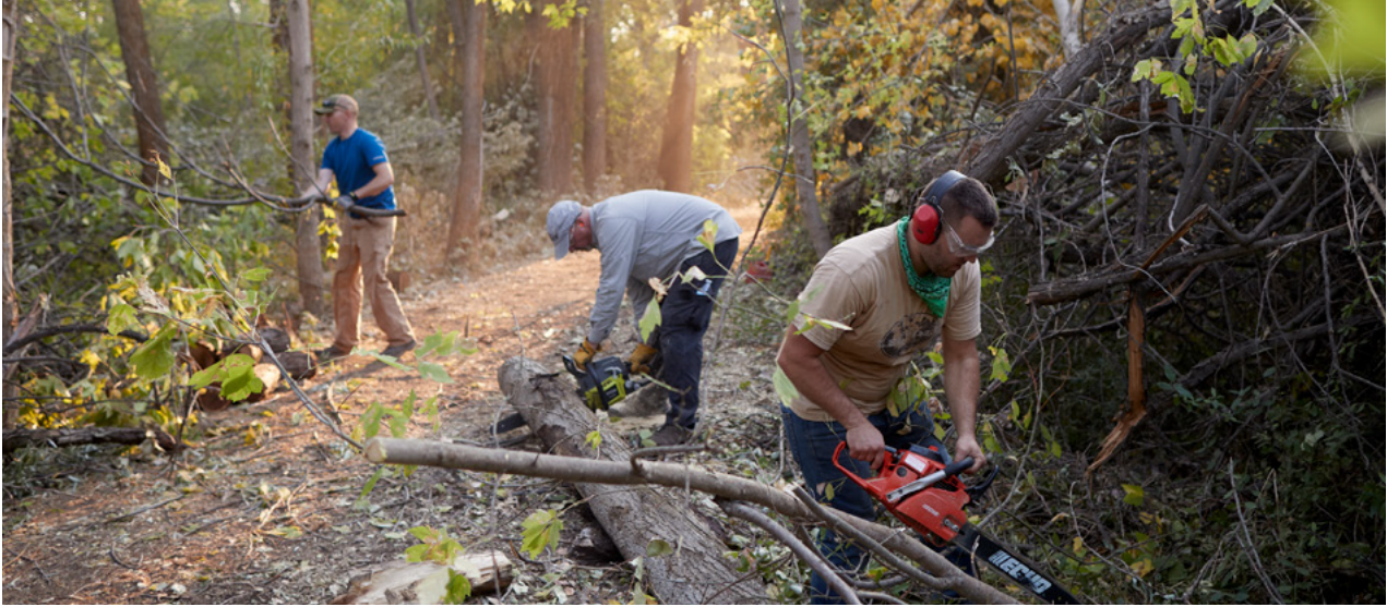
Luga: O volenitia mai se aulotu a le Ekalesia i Kaysville, Iuta, o loo faaputu fafie mai eria na aafia i matagi malolosi. Ona auina atu lea o fafie i tagatanuu o le Ituaiga o Navajo.