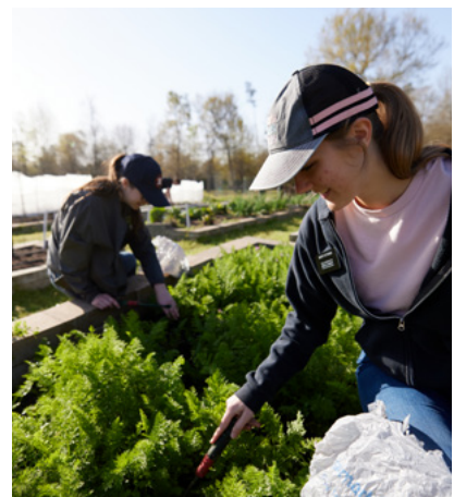
Agavale Pito i Lalo: O le faalapotopotoga o le "Fafaga luta" na aoina mai ai le faitau afe o foai o meaa mai le salafa o le setete i le itiiti ifo ma se aso.