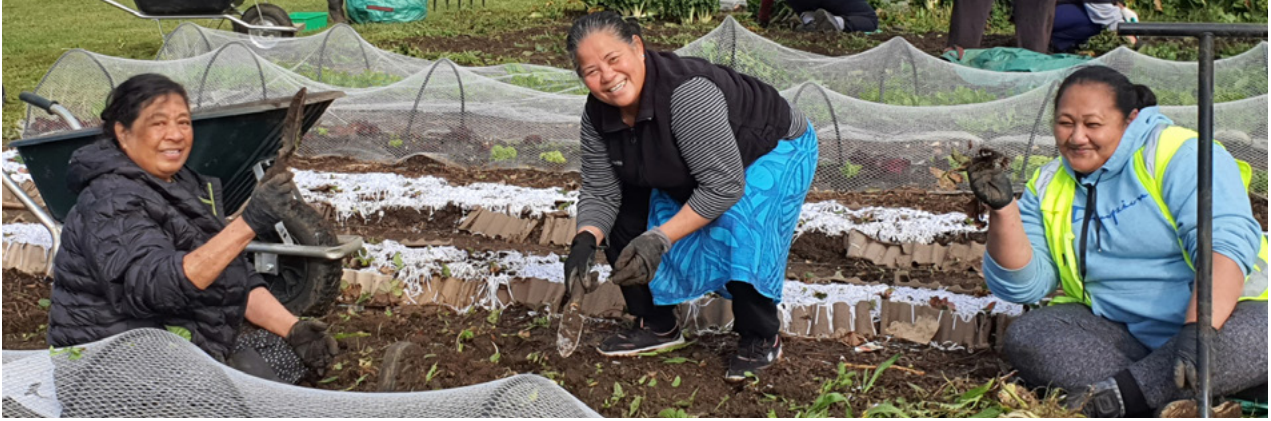
Luga: O tagata o le Ekalesia i Aukilani, Niu Sila, ua galulue faatasi ma isi faalapotopotoga a le alalafaga e vele togalaau ma faamatagofie lo latou nuu.

“Ia e alofa atu i lē lua te tuaoi e pei o oe lava ia te oe.”