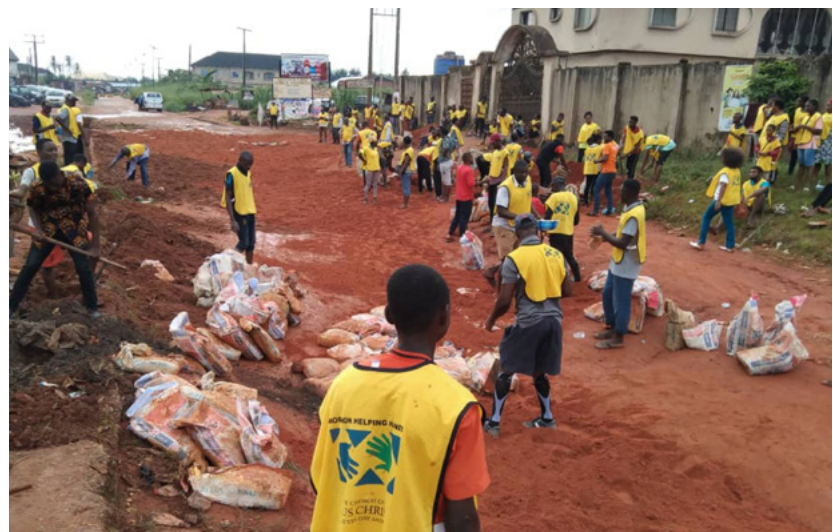
Luga: Ua faatulagaina tagata o le Ekalesia i Kana e toto ni fatulaau e 15,000 mo le Aso Atoa o Auaunaga i Aferika i le 2021.

I POLIVIA, sa aoina ai e tuafafine o le Aualofo o le Siteki a Los Andes ni pulou palasitika se 34,000 e lagolago ai le ta’imua a Niño Feliz, lea e fesoasoani i tamaiti e maua lalalo tupe maua o loo fai o latou togafitiga kimo i le mai o le kanesa. Ma sa asiasi atu tagata o le paranesi a Khovd i Monokolia i lo latou Nofoaga o Sauaga i le lotoifale e foai atu ni palanikeke mafanafana, sapalai mo pepe faatoa fananau mai, ma pusa o mea e faaoga mo le tumama.