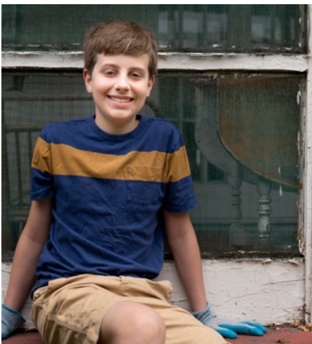
Agavale Pito i Luga: O volenitia ua galulue faatasi ma isi e faamama le otaota na mafua mai i le Afa o Ida i le Uluai Ekalesia Metotisi Tuufaatasi i Hammond, Louisiana.