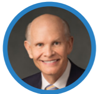
D. Dale G. Renlund