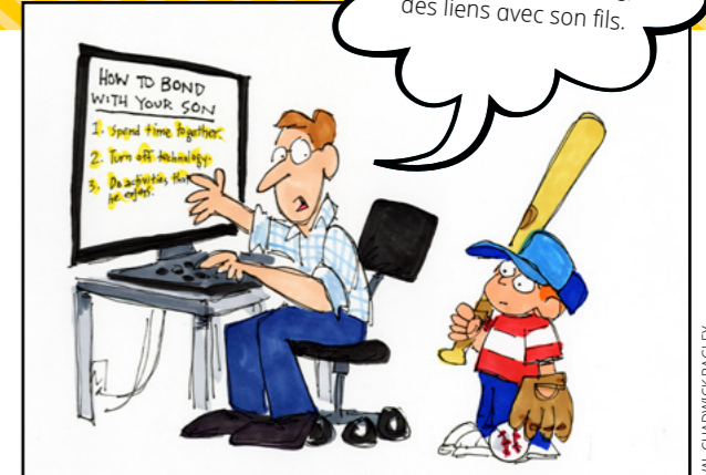
VAL CHADWICK BAGLEY

Relie les points pour voir ce groupe de personnes qui attendent que le roi Benjamin leur parle depuis la tour.