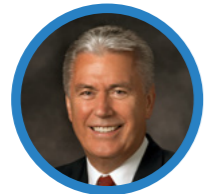
B. Dieter F. Uchtdorf