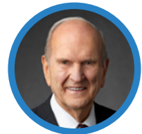
A. Russell M. Nelson

« Chers parents, merci pour tout ce que vous faites pour élever vos enfants. Les enfants, merci aussi pour tout ce que vous faites pour élever vos parents. »