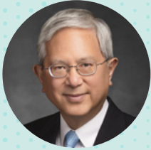
十二使徒定員会 ゲレット・W・ゴング長老