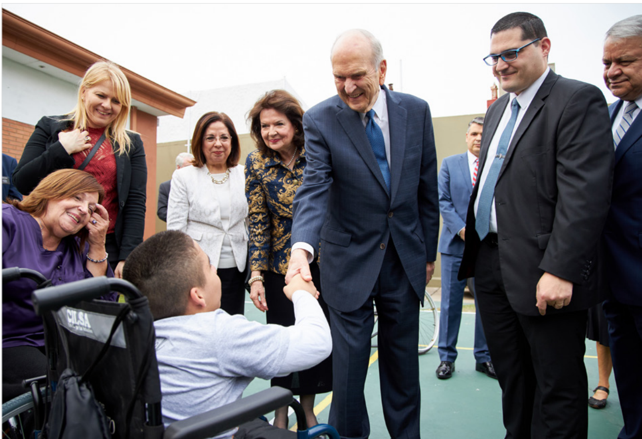
Itaas: Sa panahon ng kanyang ministryo sa Latin America noong 2019, dumalo si Pangulong Russell M. Nelson sa isang pamamahagi ng wheelchair sa Argentina.