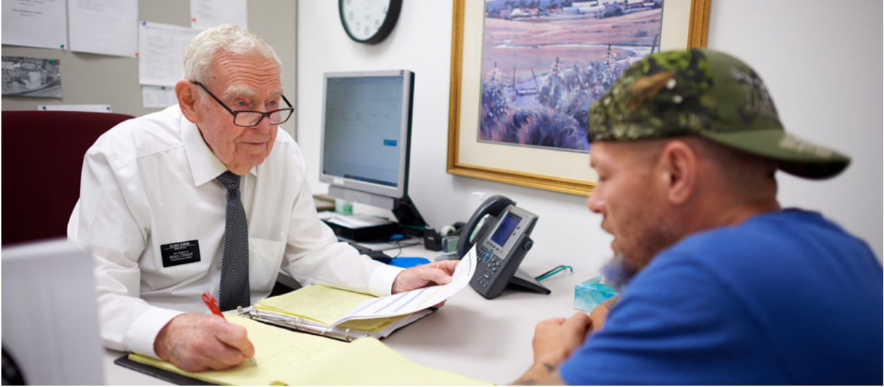
Itaas: Ang Transitional Services ng Simbahan ay nakikipagtulungan sa mga nangangailangan ng tulong sa iba't ibang pangangailangan, tulad ng tulong sa paghahanap ng trabaho at pag-access sa lokal na resources.