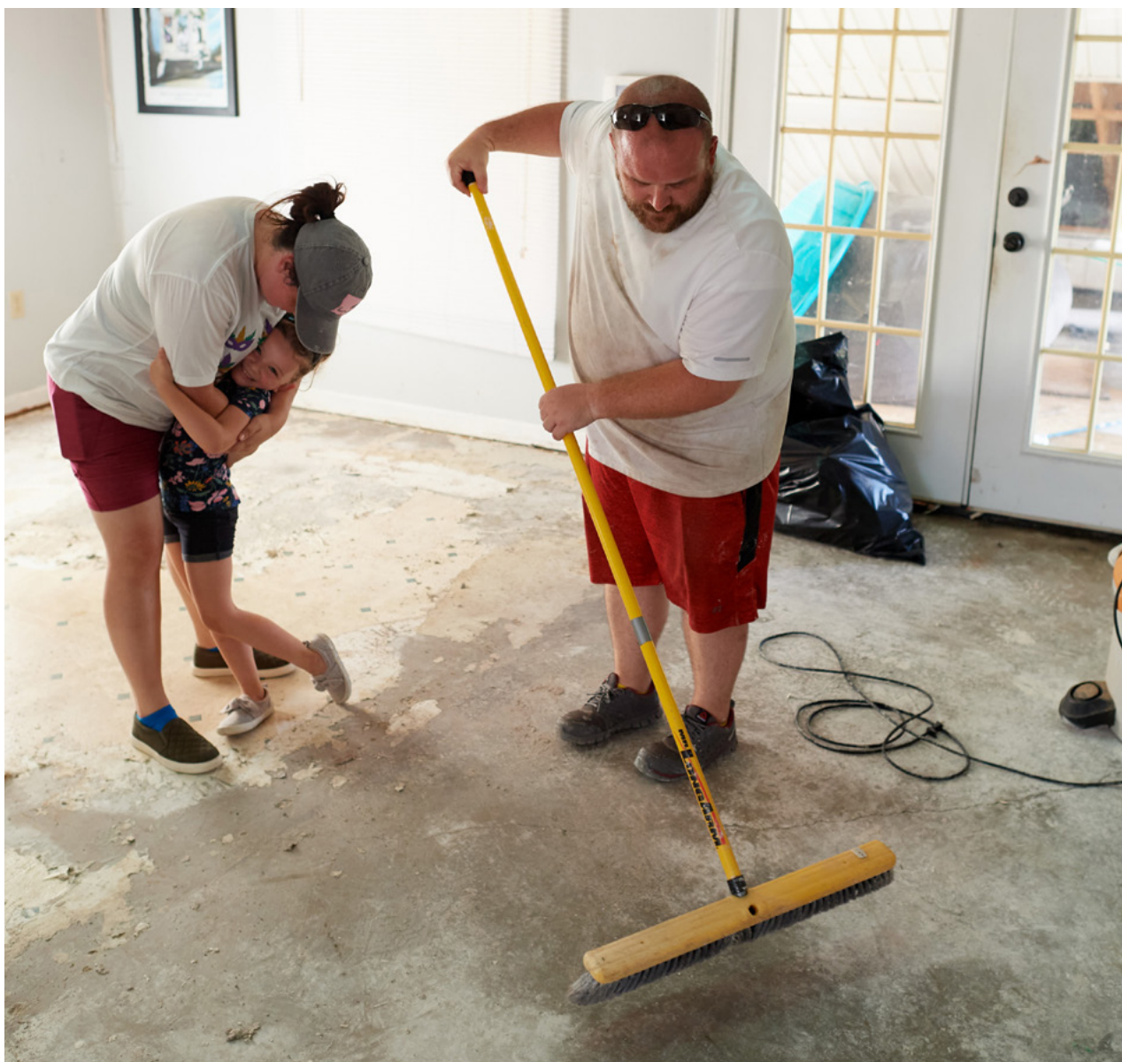
Itaas: Kasunod ng Bagyong Ida, ginugol ng mga boluntaryo sa komunidad, kabilang na ang mga miyembro ng Ang Simbahan ni Jesucristo ng mga Banal sa mga Huling Araw, ang kanilang Labor Day holiday weekend sa paglilinis.