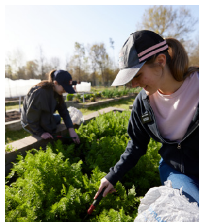
Ibaba Kaliwa: Nangolekta ng libu-libong donasyong pagkain ang "Feed Utah" food drive mula sa paligid ng estado nang wala pang isang araw.