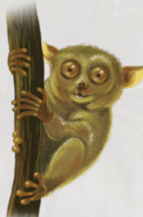
Энэ улсад дэлхийн ургамал, амьтны төрөл зүйлийн 70% нь оршдог.