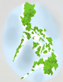
Филиппин 7600 гаруй аралтай.