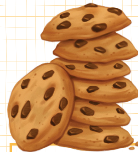
ЗУРАГ ЧИМЭГЛЭЛИЙГ АЛИССА ТАЛЛЭНТ

Чи Залуу эмэгтэйчүүдийн бүлэгтээ ямар ямар хөгжилтэй үйл ажиллагаа явуулж байсан бэ?