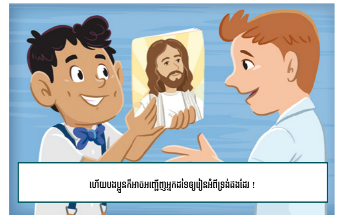
ហើយបងប្អូនក៏អាចអញ្ជើញអ្នកដទៃទៀតអំពីទ្រង់ផងដែរ !