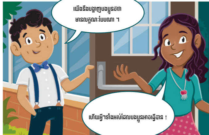
យើងនឹងបង្ហាញបងប្អូនថា មានលក្ខណៈបែបណា ។ ហើយអ្វីៗទាំងអស់ដែលបងប្អូនអាចធ្វើបាន !