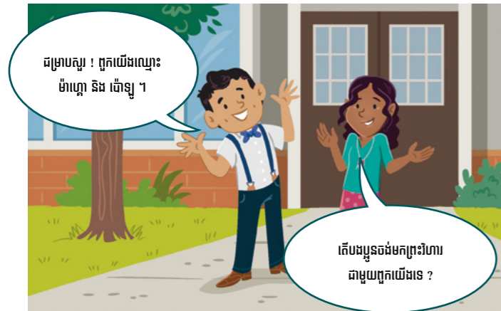
ជម្រាបសួរ ! តើយើងឈ្មោះ ម៉ាណូ និង ប៉ោឡូ ។ តើបងប្អូនចង់មកព្រះវិហារ ជាមួយពួកយើងទេ ?