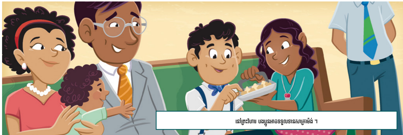
នៅព្រះវិហារ បងប្អូនអាចទទួលបានសាក្រាម៉ង់ ។