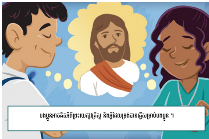
បងប្អូនអាចគិតអំពីព្រះយេស៊ូគ្រីស្ទ និងអ្វីដែលទ្រង់បានធ្វើសម្រាប់បងប្អូន ។