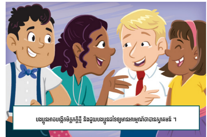
បងប្អូនអាចបង្កើតមិត្តភក្តិថ្មី និងជួយបងប្អូនដទៃទៀតមានអាម្មណ៍ចាំបាច់ស្រាប់តែ ។