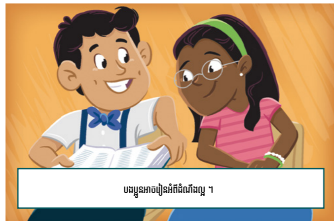
បងប្អូនអាចរៀនអំពីដំណឹងល្អ ។