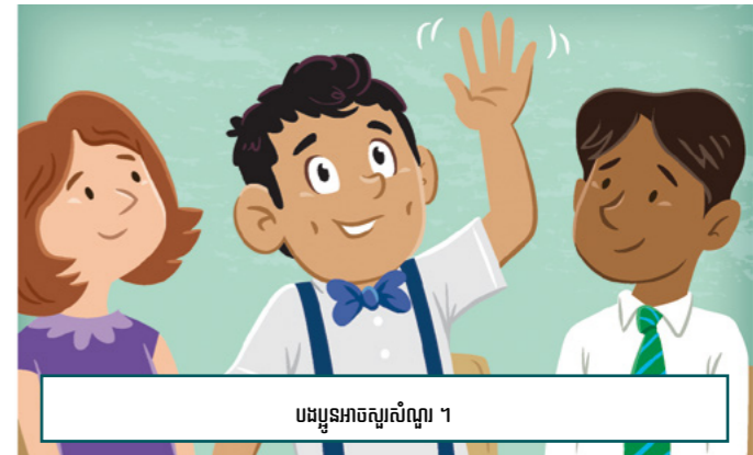
បងប្អូនអាចសួរសំណួរ ។