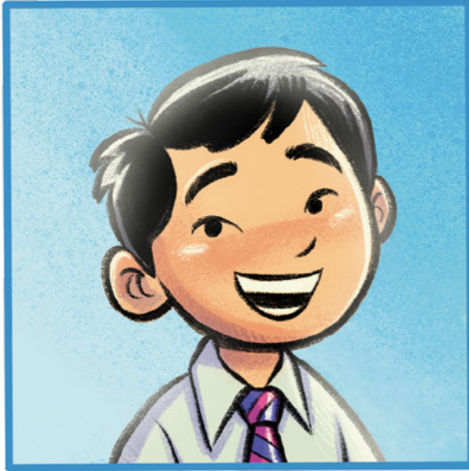
ដោយ ណែត ឌែម ( ផ្នែកនៅលើដំណើររឿងពិត )