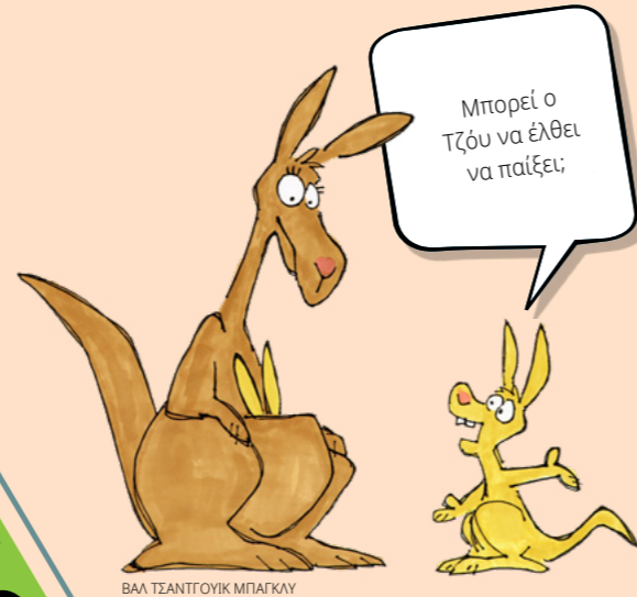
ΒΑΣΙΛ ΤΣΑΝΤΟΥΚ ΜΠΑΓΚΛΥ

Οργανώστε τα πρόβατα, ώστε όλα να ταιριάζουν τέλεια στο ποιμνιστάσιο. Μπορείτε να το κάνετε αυτό κόβοντας τα κομμάτια του παζλ στη σελίδα 29 (αφού διαβάσετε το άρθρο στην επόμενη σελίδα) και να τα τοποθετήσετε ή εναλλακτικά μπορείτε να τα ζωγραφίσετε.