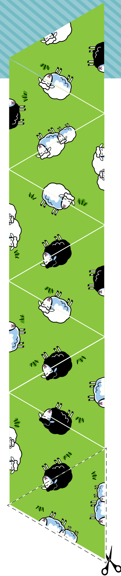
ΕΙΚΟΝΟΓΡΑΦΗΣΕΙΣ ΥΠΟ DAVID KLUG

Στο Άλμα 32, ο λόγος του Θεού συγκρίνεται με έναν σπόρο που είναι «φυτεμένος στην καρδιά σας». Μπορείτε να «φυτέψετε» καθέναν από τους εννέα διαφορετικούς σπόρους γεμίζοντας το πλέγμα; Πρέπει να έχετε έναν (και μόνον έναν!) κάθε είδους σπόρο σε κάθε σειρά, στήλη και χρωματιστό πλαίσιο.