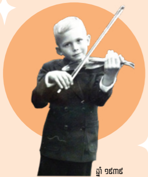
ឆ្នាំ ១៩៣៩

មើលថាតើសាសនាចក្របានរីកចម្រើនប៉ុណ្ណា ចាប់តាំងពីប្រធាន អ្នក បានកើតមក !