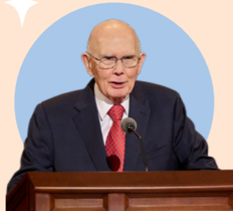
ឆ្នាំ ២០២៤