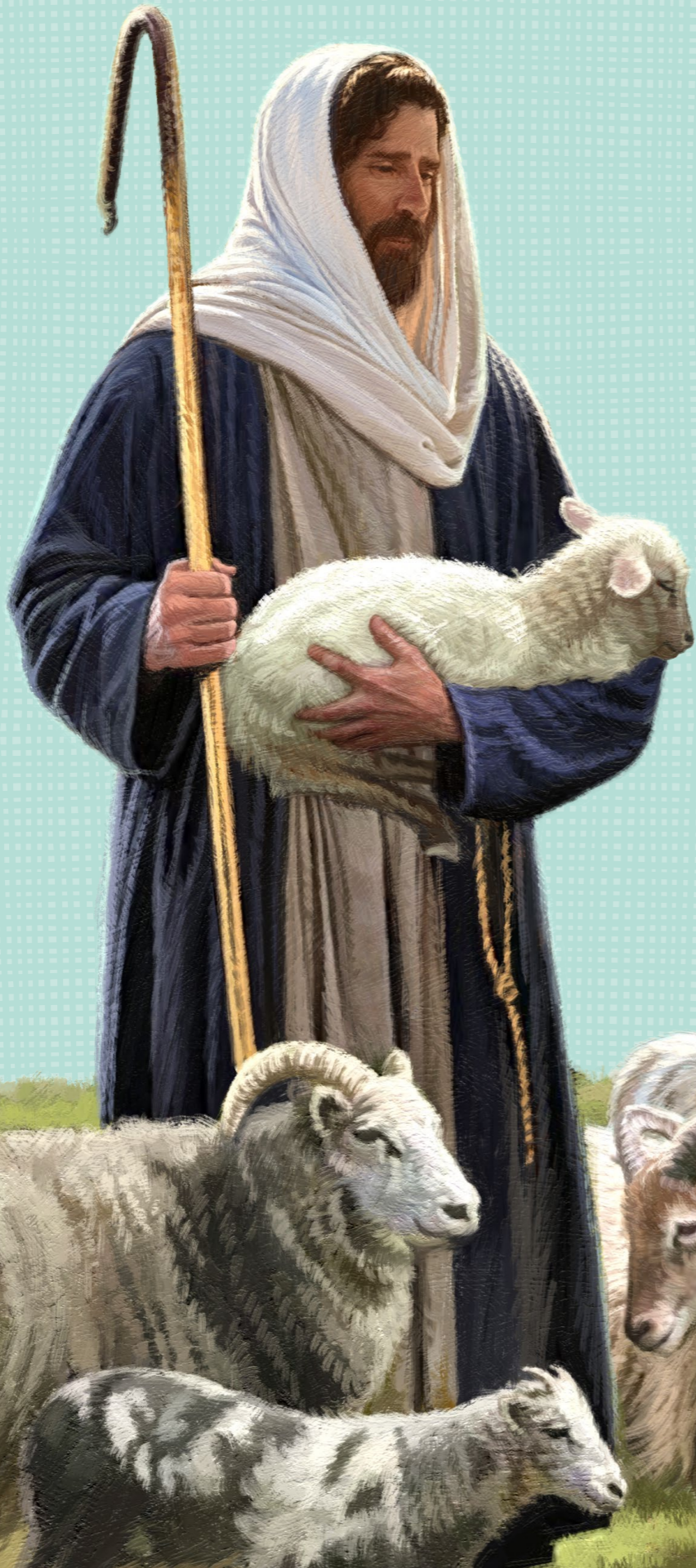
장갑: 비라게하라, 장신, 그분의 이름(그리스도)

예수 그리스도는 선한 목자라고 불리세요. 우리는 그분의 양과 같아요. 그분은 우리를 돌보시고 인도하세요. 신약전서에서 예수님은 세상의 다른 곳에 사는 “다른 양들”이 있다고 가르치셨어요.(요한복음 10:16) 예수님은 부활하신 후에 미 대륙에 있는 그 사람들을 방문하셨어요. 주님은 그들을 축복하시고, 치유하시고 가르치셨어요. 예수님은 예루살렘의 백성들을 사랑하신 것처럼 그들을 사랑하셨어요. 전 세계에는 예수님의 다른 양들이 있어요. 그분은 하나님 아버지의 자녀가 어디에 살든지 모두 사랑하세요. 예수님은 여러분을 사랑하세요! ●