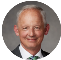
Старейшина Майкл О. Данн Член Кворума Семидесяти