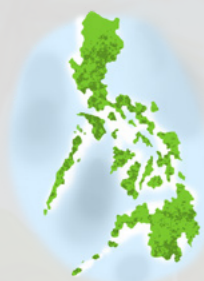
Ang Pilipinas adunay kapin sa 7,600 ka isla!