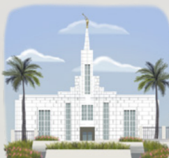
Sa dili madugay ang Pilipinas makabaton ug walo ka templo.