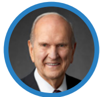
A. Presidentti Russell M. Nelson

"Vanhemmat, kiitos kaikesta, mitä te teette kasvattaaksenne lapsianne. Ja lapset, kiitos kaikesta, mitä te teette kasvattaaksenne vanhempianne."