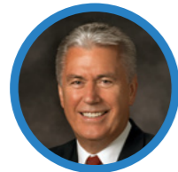
B. Vanhin Dieter F. Uchtdorf