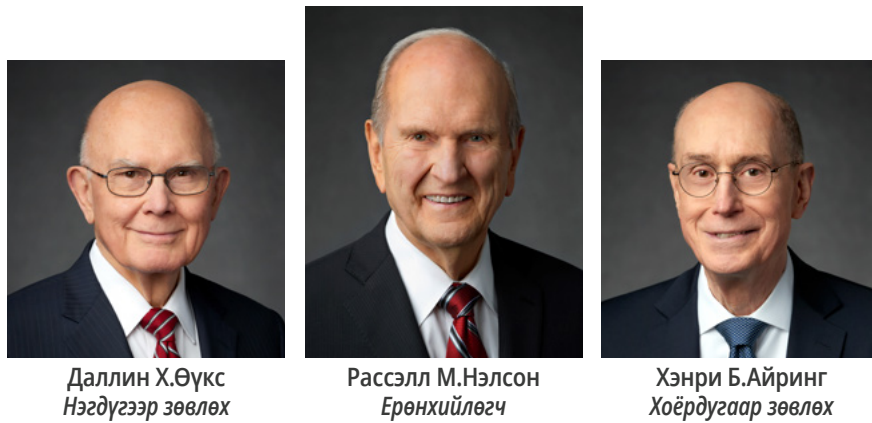
Даллин Х.Өүкс Нэгдүгээр зөвлөх Рассэлл М.Нэлсон Ерөнхийлөгч Хэнри Б.Айринг Хоёрдугаар зөвлөх