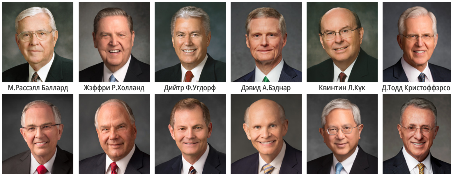
М.Рассэлл Баллард Жэффри Р.Холланд Дийтр Ф.Угдорф Дэвид А.Бэднар Квинтин Л.Күк Д.Тодд Кристоффэрсон Нийл Л.Андэрсэн Роналд А.Расбанд Гари Э.Стивэнсон Дэйл Г.Рэнланд Гэррит В.Гонг Улиссэс Соарэс