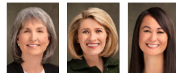
Ж.Анэтт Дэннис Нэгдүгээр зөвлөх Камилл Н.Жонсон Ерөнхийлөгч Кристин М.Еий Хоёрдугаар зөвлөх