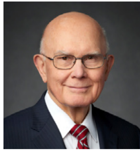
Dallin H. Oaks Pierwszy Doradca