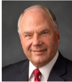
Ronald A. Rasband