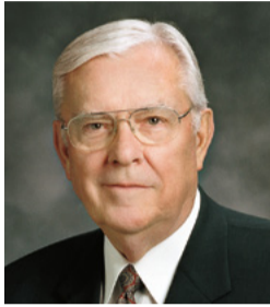
M. Russell Ballard