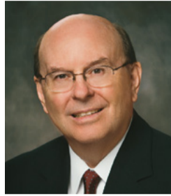
Quentin L. Cook