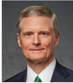
David A. Bednar