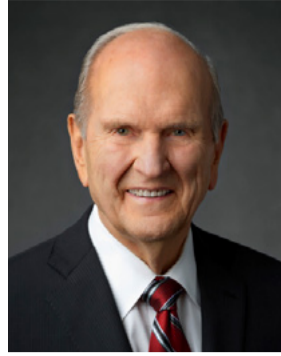
Russell M. Nelson Prezydent