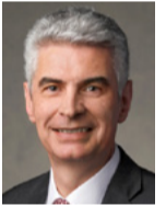
Gérald Caussé Przewodzący Biskup