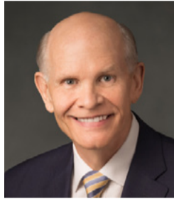
Dale G. Renlund