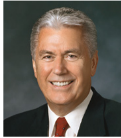
Dieter F. Uchtdorf