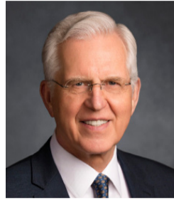
D. Todd Christofferson