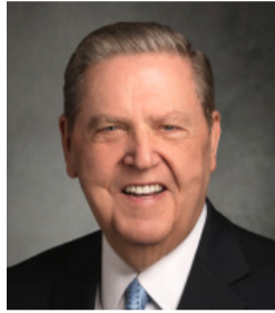
Jeffrey R. Holland