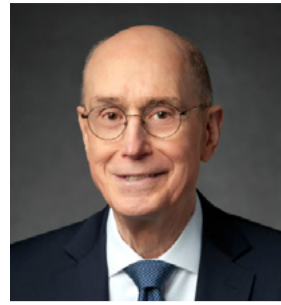
Henry B. Eyring Drugi Doradca